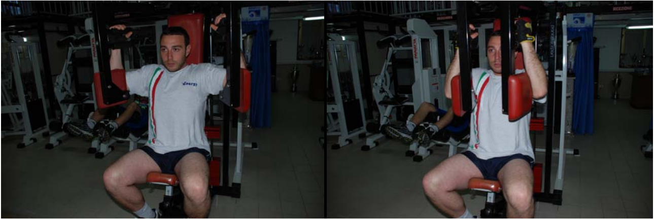
Qui impegnato alla “Pectoral”