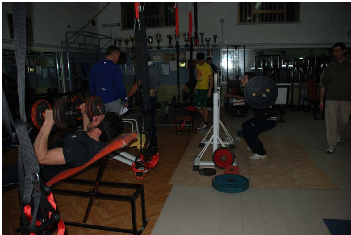
La Palestra "Natural"... da sempre offre un ambiente di relax, di cordialità e di amicizia!!!