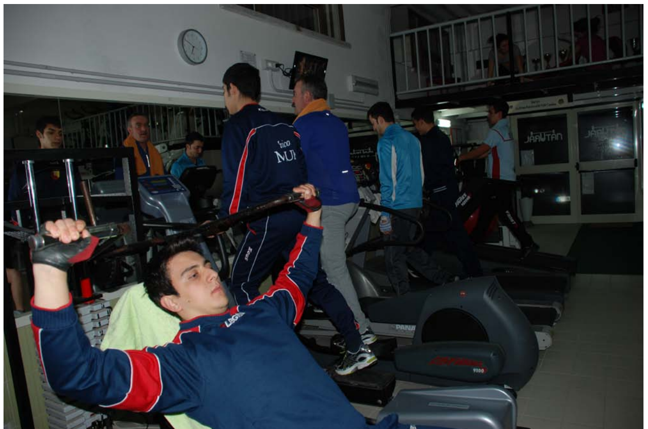
E' bello vedere chi si dedica alla sana attività fisica... lontano dal vizio, dalla violenza, dalla droga!!!