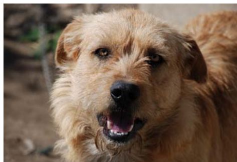
Roky... ottimo guardiano, la sua casetta è alle spalle della “Natural”