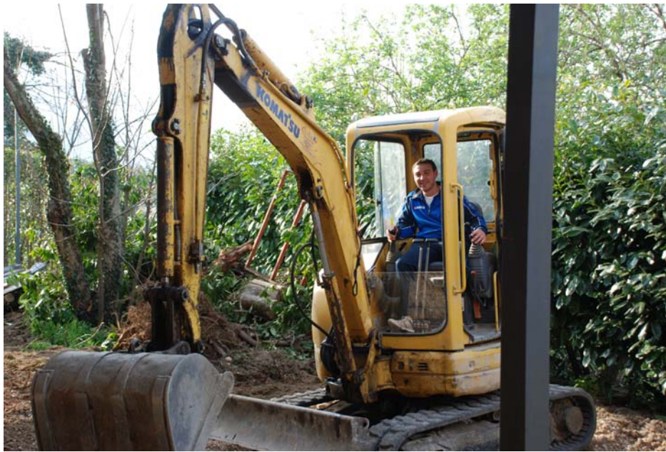
e qui, nello spazio adiacente alla Palestra “Natural”, impegnato in un’altra attività...