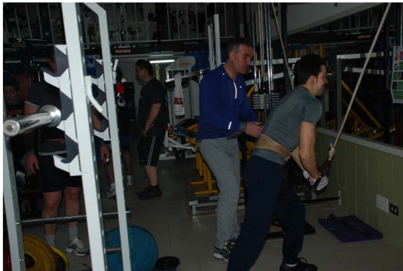
Ci si assiste vicendevolmente