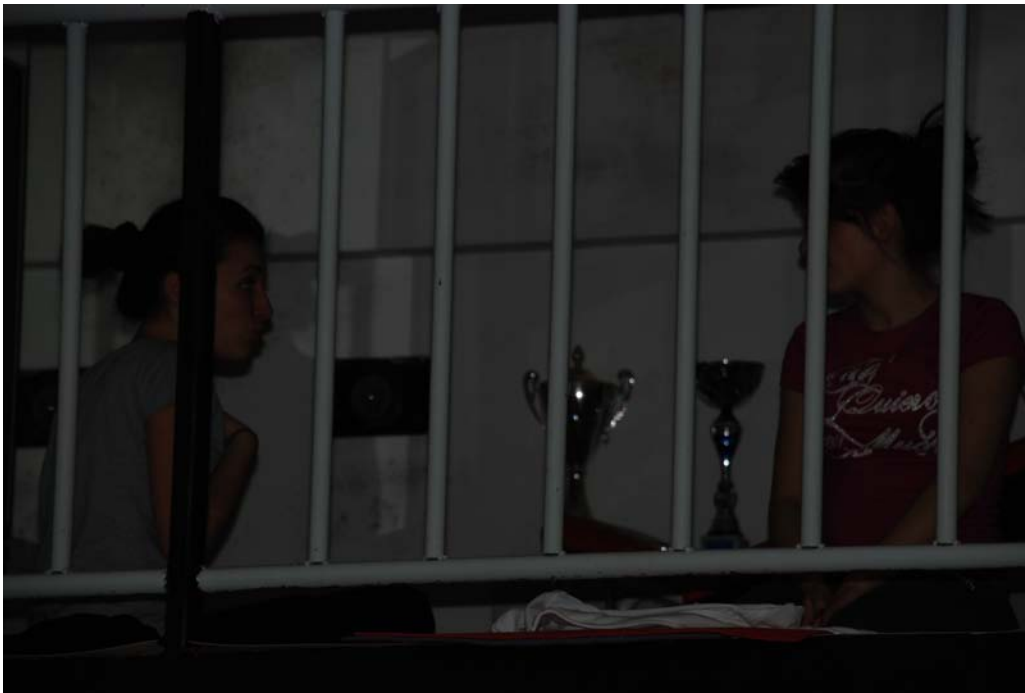
Piacevole chiacchierata sul “soppalco”... in un momento di relax