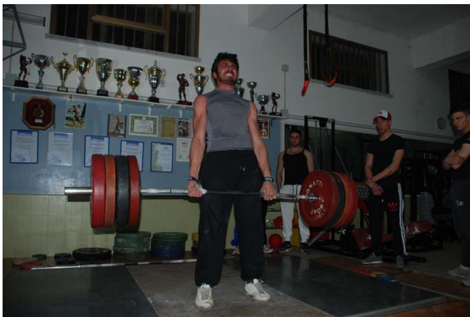
portati a ...buon fine! Bravissimo!!!