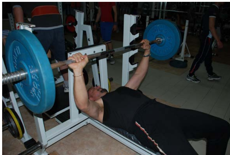
Pino alla Panca