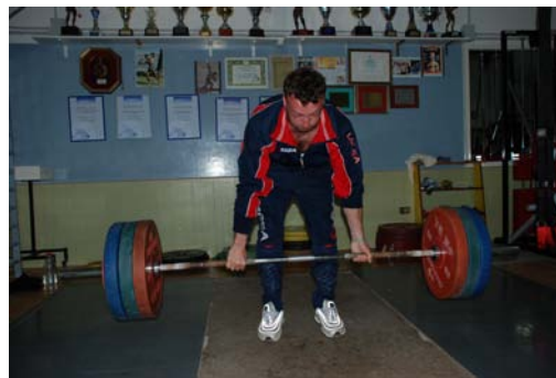
è costretto a fare da solo...