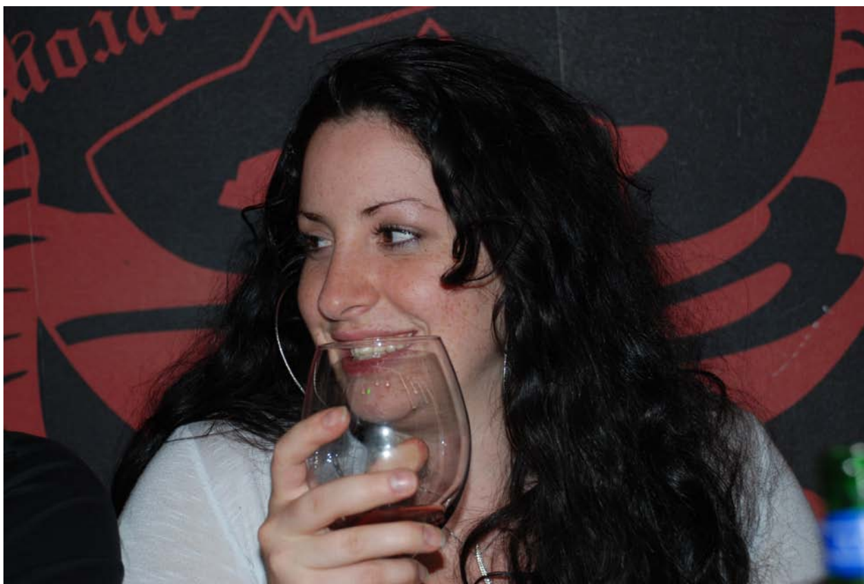
Nel locale "Roy" di Campize-Rotondi