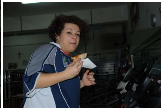
Talmente buona che non ci rinuncia nemmeno ...correndo!