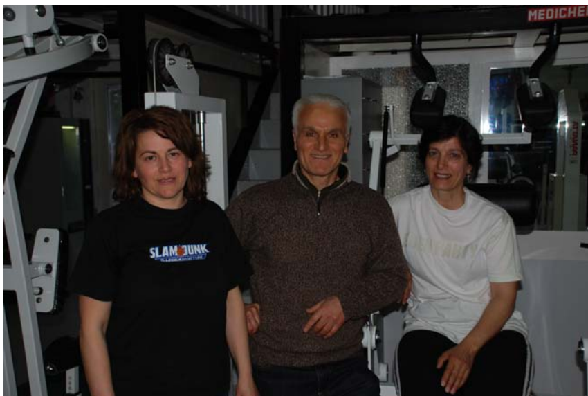
Trovarsi fra due belle e gentili Signore non è da poco, anzi...!