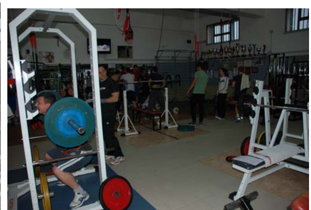
è la "NATURAL"