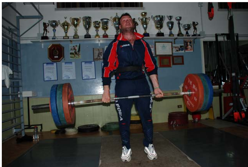
e ci riesce egregiamente!