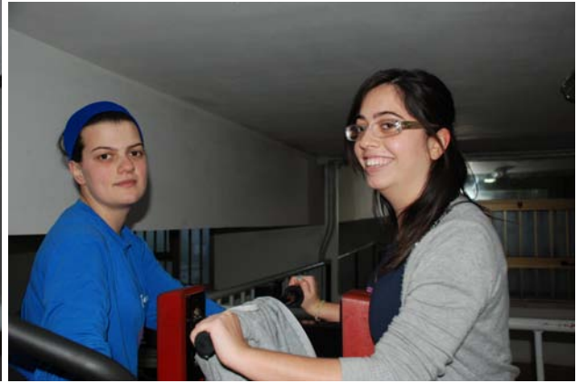
“...le ragazze della “Natural” sono tutte carine e simpatiche”