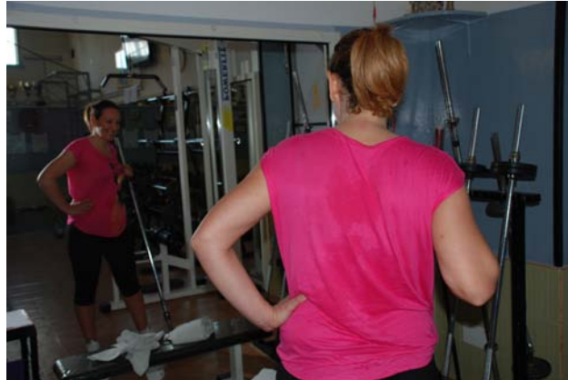
Il responso dello specchio è positivo, si sa!