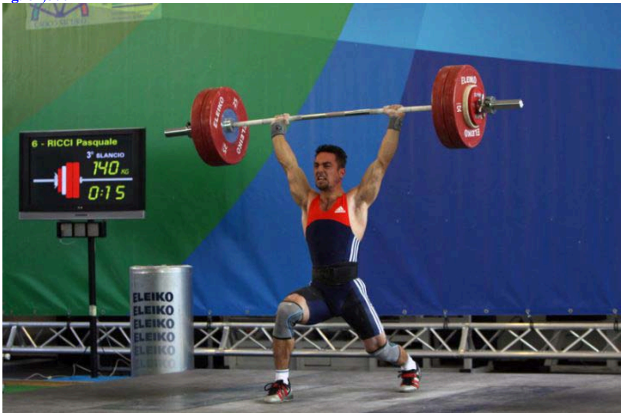
Peso del bilanciere sollevato Kg. 140, un'impresa eccezionale per un atleta di piccola taglia, non professionista, non appartenente a corpi organizzati e, peraltro, con numerosi impegni!