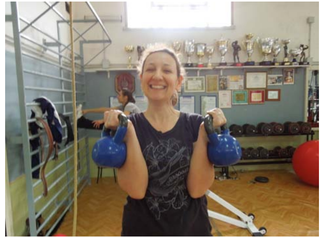
Sorriso e simpatia sono sponsorizzati generosamente...