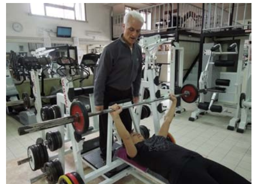
Vai tranquilla... ci sono io!