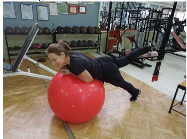
Attentaaa... stai scivolando!