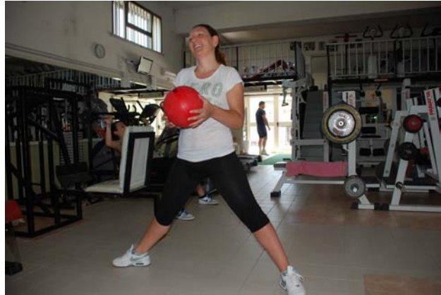
Ottimi affondi laterali, con l'ausilio della palla medica