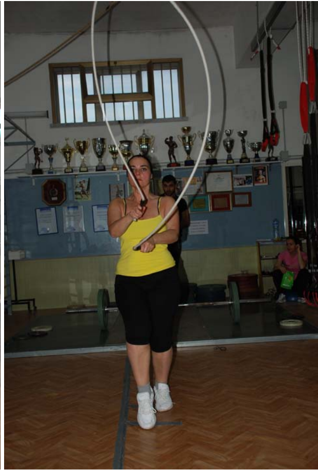
Bravissima alla “Corda”